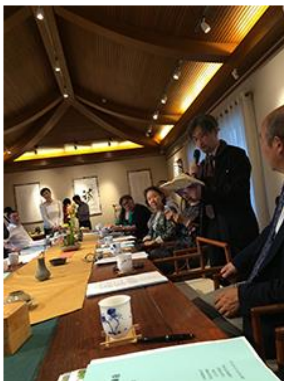
中日诗人朗诵会现场

每一位诗人渗入灵魂深处的诗歌朗读，让大家感受到了荡涤心灵的强大力量，也让大家无限珍惜这份来之不易的机缘。大连外国语大学的学生，分别用汉语和日语朗诵了诗歌，给大家带来了母语之外的诗歌美妙，诗人们纷纷称赞。对学生来说这是一次非常有意义的人生体验。