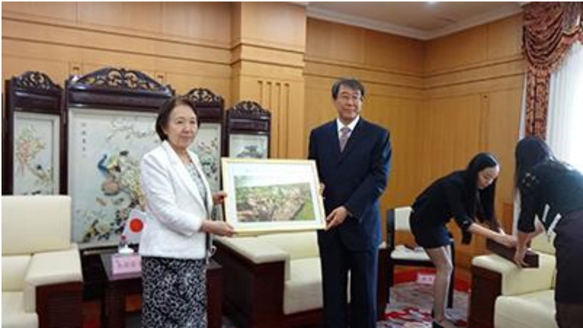
大连理工大学赠送水田樱花纪念照