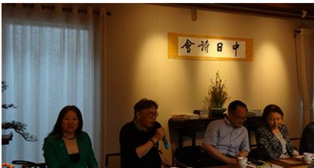
著名诗人西川致辞

2015年6月2日下午，由日本城西国际大学、株式会社思潮社、大连市作家协会、大连海燕文学月刊社等单位共同举办的“中日诗歌朗诵会”在大连“汉风文化方舟”举行，这是大连诗歌界首次与外国诗人同台亮相。中国著名诗人西川、潇潇，大连优秀诗人宁明、李皓、孙甲仁、大路朝天、郭玉铸、季士君、曾晖、点点、李佳忆等倾情出席。日本方面，日本著名诗人、评论家水田宗子女士、著名诗人吉增刚造先生、旅日诗人田原先生列席。