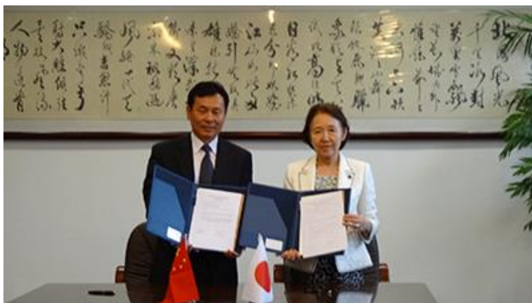
与东北财经大学夏春玉校长签署协议

会议结束后，两校签署了合作交流框架协议书。基于本协议，两校将商议推进中日共同研究，推进在经营、福祉、媒体、观光、人文、环境等领域的研究生 1+1 培养项目。