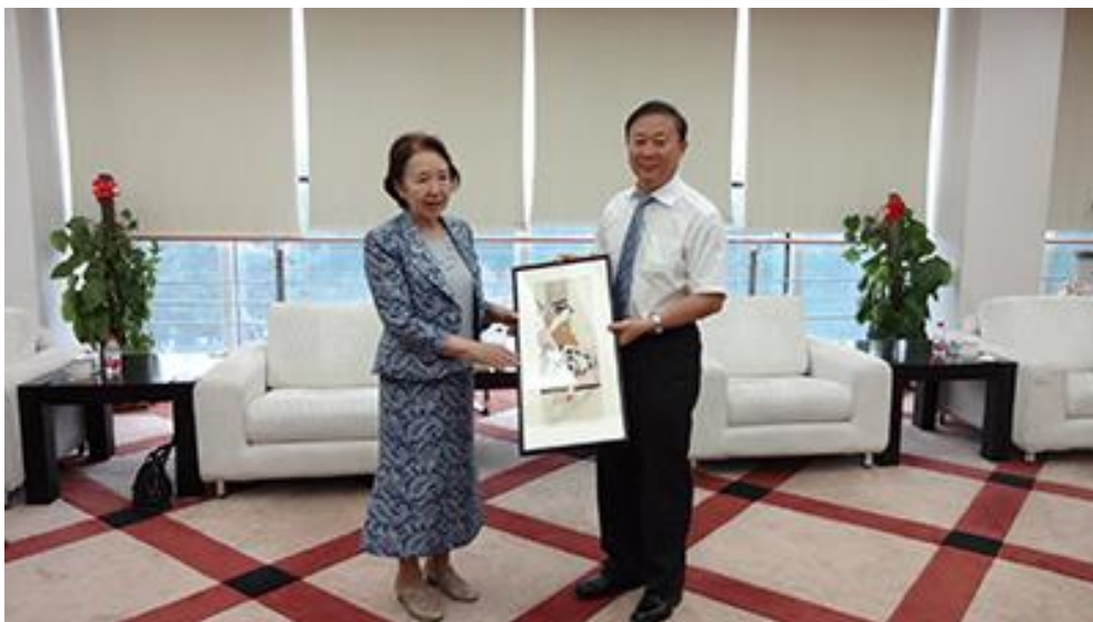
与东北大学赵继校长合影

2015年6月4日下午，与新上任的赵继校长进行了亲切友好会谈。赵继校长深知两校之间不断加深的合作和友谊以及已取得了丰硕成果，首先对中日联合培养博士班的共同教育表示感谢。有留日履历的赵继校长，希望双方能够继续加强在教师交流、学生交换、科研合作等方面的合作，并建立长效、稳定的合作机制。