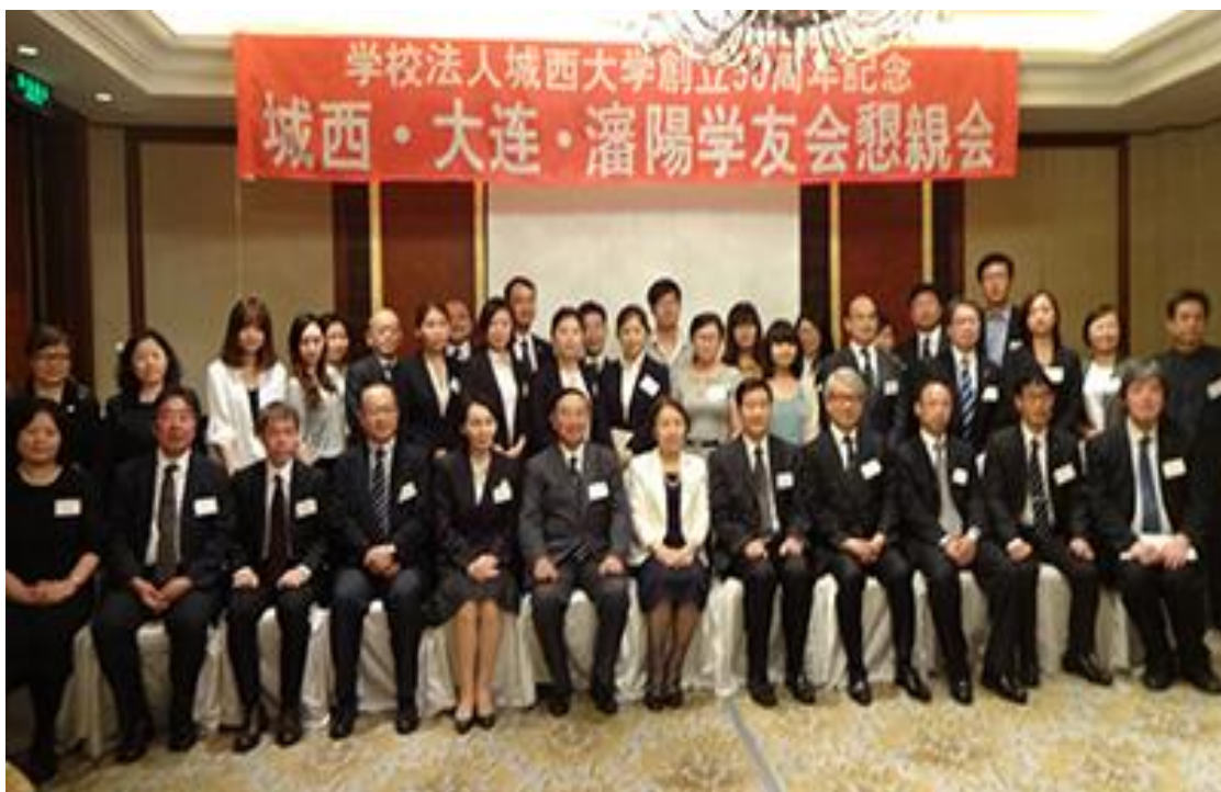
校友会与会人员纪念照

随后，城西大连·东北校友会，为庆祝母校创立 50 周年，向母校赠送了大连市象征的金合欢树以及水田三喜男纪念馆装饰画。