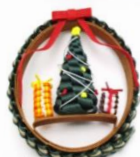
クリスマスリース