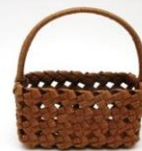
四つだたみプチバスケット