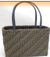
3本とばしのあじろバッグ