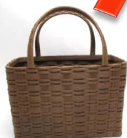
お買いものバッグ