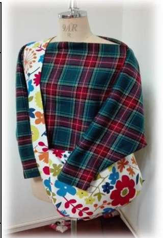
リバーシブル メッセンジャーバッグ