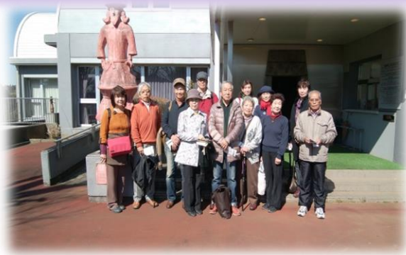
はにわ博物館 吟行会