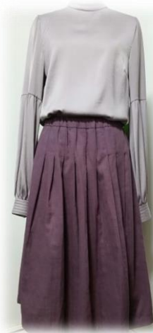
プリーツスカート

日 程: 上記参照 定 員: 10名 月曜日 全5回 時 間: 10:00~12:00 受講料: 5,000円 (1回/1,000円) 材料費: 上記表参照ください。 持ち物: 特にありません。