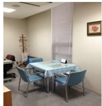
相談室の中の写真